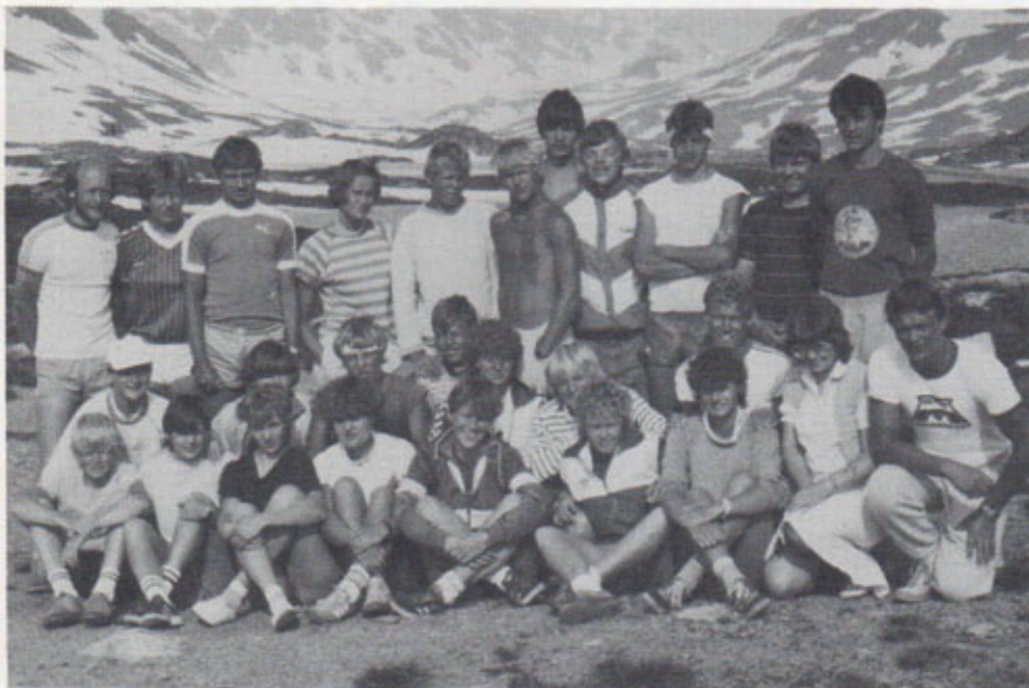
Fra een af de succesrige Norgesture - 1983.

Håndboldafdelingen laver kampprogram ved hjemmestævnerne i Grenaahallen. Der bliver speaket til 1. holds kampe.