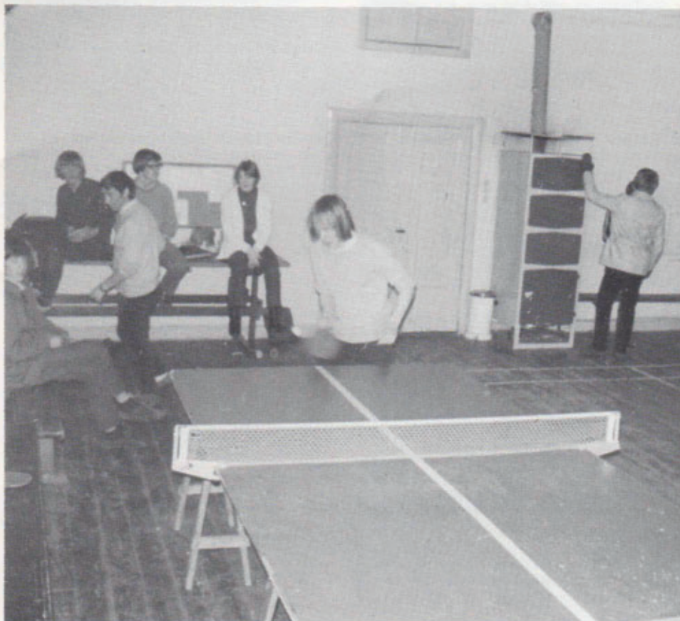
Der spilles bordtennis - med en mere moderne kakkellov som baggrund. Vinteren 1970-71.

Mange medlemmer mødte op på begge de ugentlige spilledage, selv om vi hver især kun spillede badminton og bordtennis den ene aften, så efterhånden var der mere liv i forsamlingshuset, end det længe havde været tilfældet. Bestyrelsen nærrede en sikkert overdreven frygt for, at leg og "drengestreger" skulle sætte sine spor i bygning og inventar, så vi blev allerede dengang udsat for hovedrystende ungdom, når vi forsøgte at irettesætte de yngste medlemmer. Der opstod dog aldrig de helt store problemer.