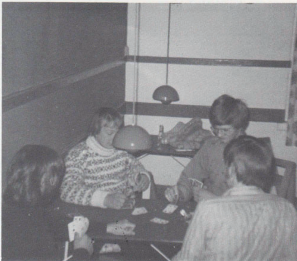
Det moderniserede klublokale.

sæson. Der var betydelig tilslutning til klubaktiviteterne, og mange medlemmer kom hver eneste klubaften året rundt. En typisk aften bestod af megen snak, der blev drukket sodavand og spist slik, der blev spillet kort og hørt musik, de få rygere fik tændt, delt og slukket samme cigaret flere gange, og de der p.t. "kom sammen" fik sendt hinanden underforståede blikke, talt sammen eller ligefrem holdt hinanden i hånden på sådan en aften. Alt i alt var der tale om et forum, hvor en gruppe - i det væsentlige teenagere - havde fundet et velfungerende samlingspunkt, der også udviklede et betydeligt sammenhold.