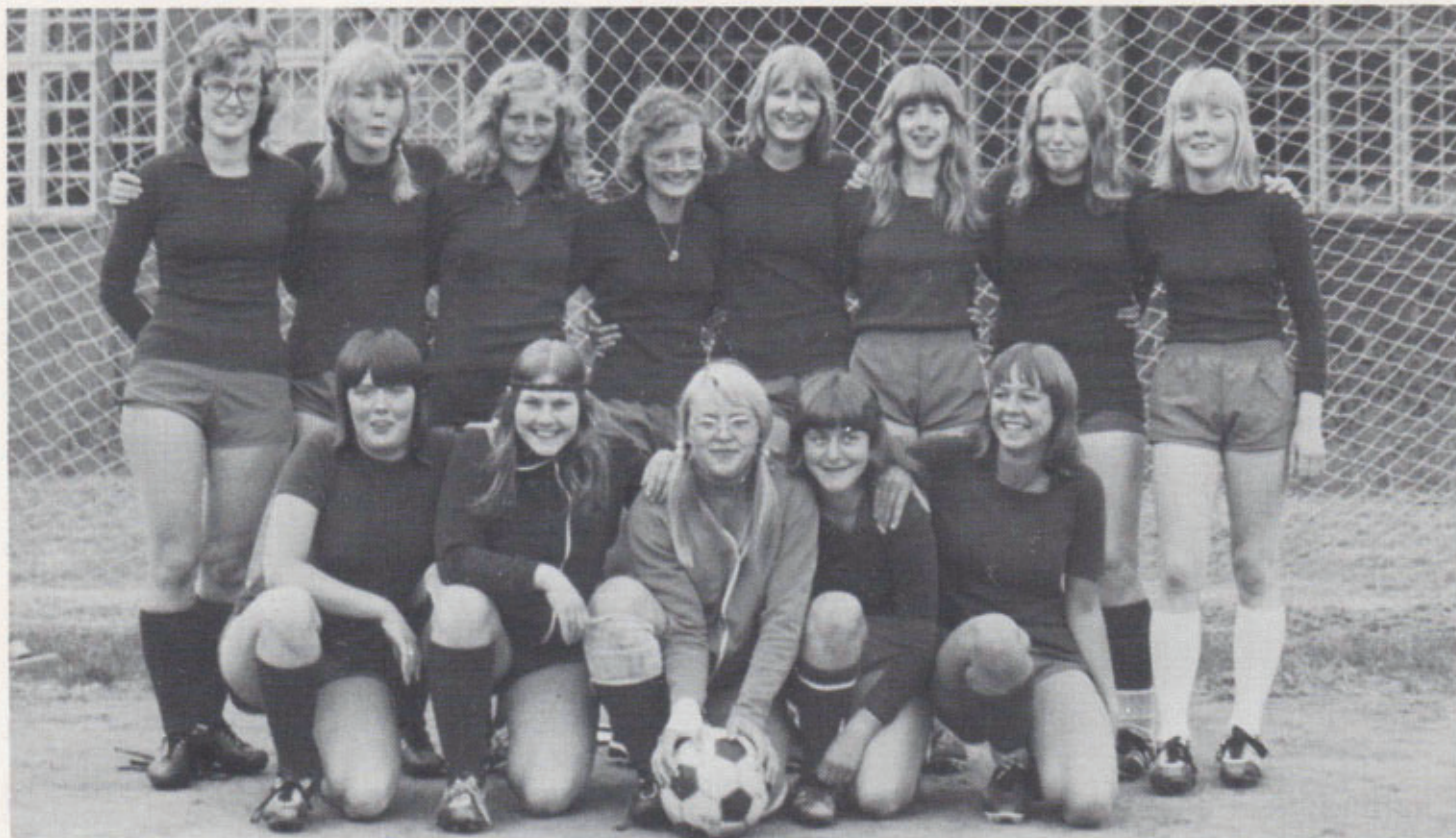
Foreningens første fodboldhold - Damer. Sommeren 1972.