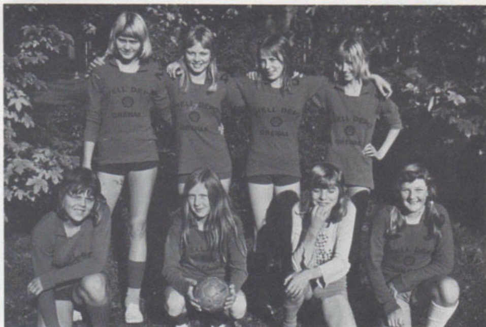
Håndboldpiger 1974. Flere af disse piger blev grundstammen i de hold, der senere nåede store resultater.

10 håndboldpiger til Ollerup på Fyn med Jøsse og Lissy som ledere.