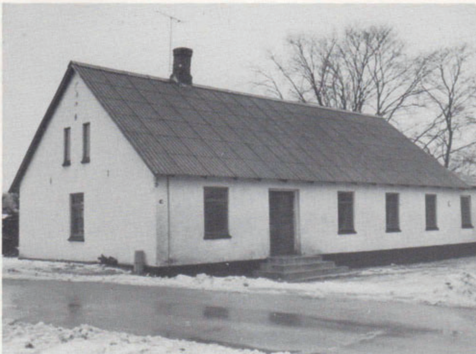
Åstrup forsamlingshus - Foreningens hjemsted gennem mange år.

Som det fremgår af ovenstående om husets faciliteter, var omklædnings- og bademulighederne yderst begrænsede. Omklædning kunne om ønsket ske i en uopvarmet og uisoleret garderobe på loftet, og husets eneste vandhane - i køkkenet - var ofte dybfrossen. I disse perioder forsvandt dog de synlige tegn på anstrengelser, hvis man klædte om i frostgraderne på loftet.