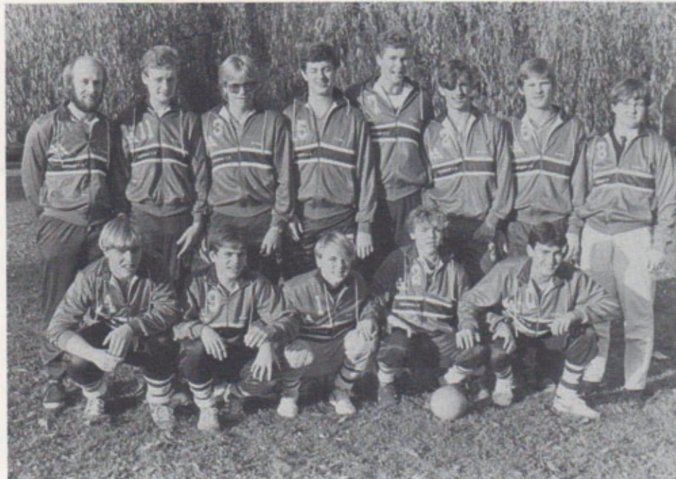
Håndboldafdelingen fik i 1984 herre juniorerne med i Dansk Håndbold Forbunds højeste række. Herre junior division vest.

Nogen sportslig satsning er der ikke tale om, da målsætningen helt klart satser på at få det sociale til at fungere.