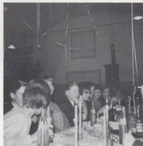
Fest i forsamlingshuset - Bemærk kakkellovnen og det runde loft.

Sæsonen blev dog allerede det første år afsluttet med klubmesterskaber, så den 6. april 1966 kunne vi kåre foreningens første klubmestre.