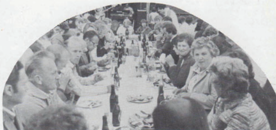
Sommer og beboerfest på den gamle sportsplads - 1979.