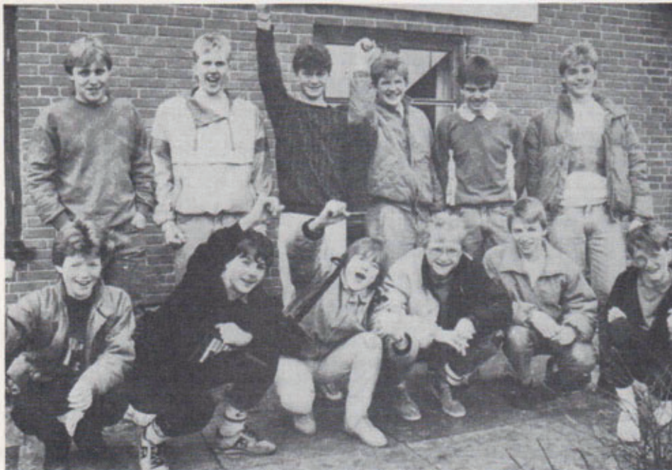
Drengeholdet der blev jysk mester i håndbold 1986.