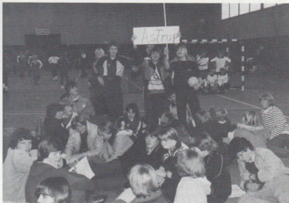
Håndboldspillere i Ollerup - 1981.

Fodboldafdelingen beslutter, at seniorfodbold skal foregå således, at man om foråret træner og spiller i Hammelev og om efteråret i Åstrup.