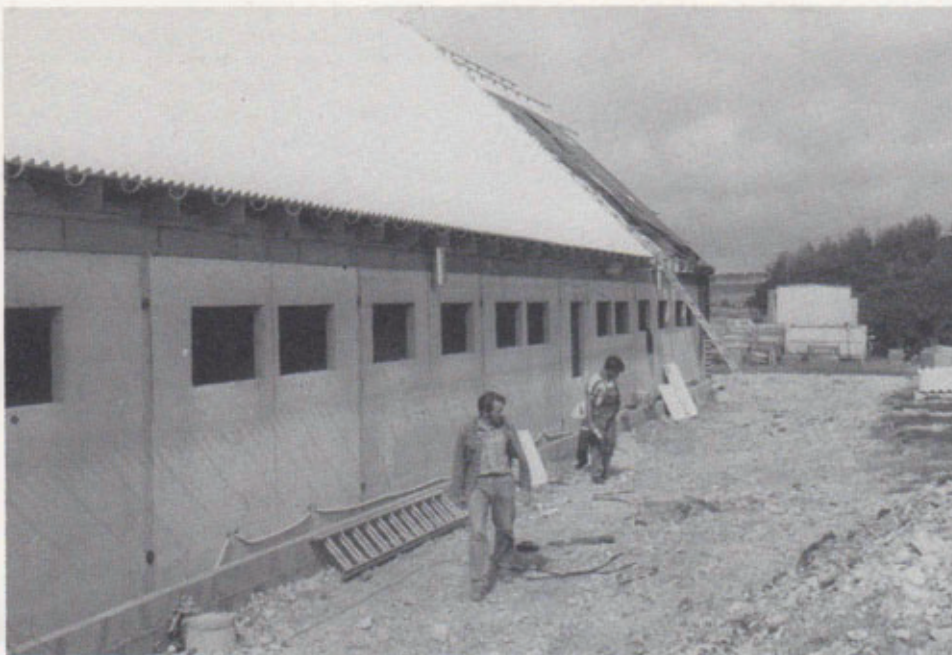
Foreningens nye klubhus under opførelse 1989