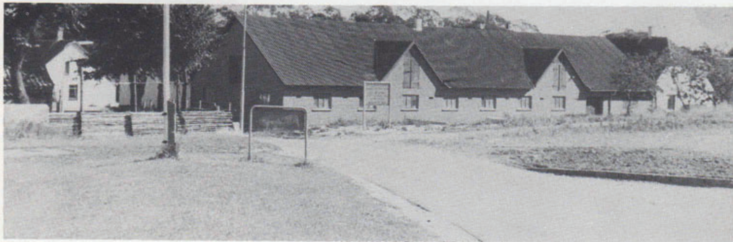
Den nuværende ungdomsgård før ombygningen. Billedet er taget fra den gamle sportsplads 1979.

Efter mange møder med Grenaa Kommune er der forslag om 2 muligheder for placering af nye baner: