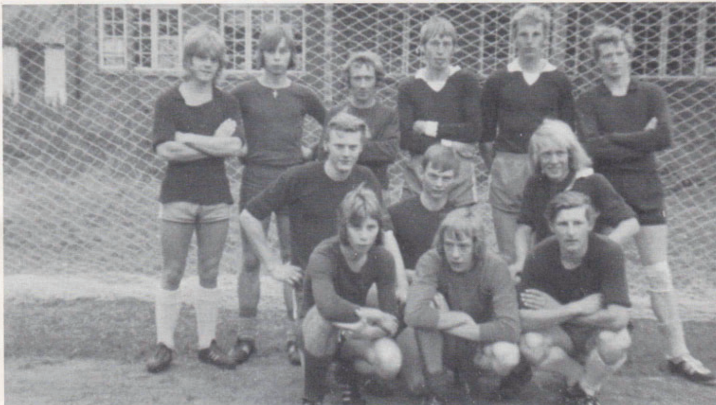
Foreningens første fodboldhold - Herrer. Sommeren 1972.

spillet på en rimelig kontant måde, men dommeren lod pænt spillet fortsætte, og gik så hen til målvogteren og sagde, at hvis noget tilsvarende gentog sig, ville han være nødt til at dømme straffespark!