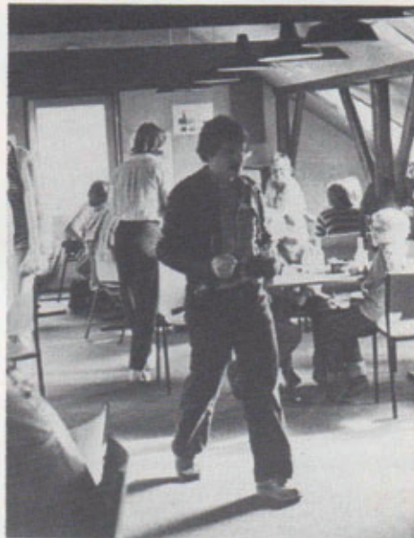
Foreningens klublokale som vi flyttede ind i 1980.

I denne periode startes der drengeshåndbold, microhåndbold og damegymnastik.