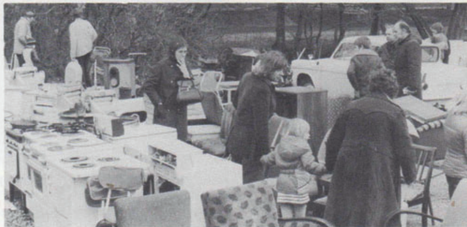
Loppemarked - 1976